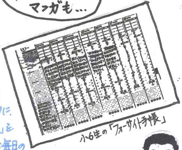
小6生の「フォーサイト手帳」

※当教室では、生徒一人ひとりに「フォーサイト手帳」を授けて、毎週・毎日の「時間・行動管理」を指導しています。